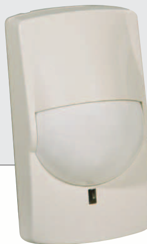
MX-40PT / MX-50