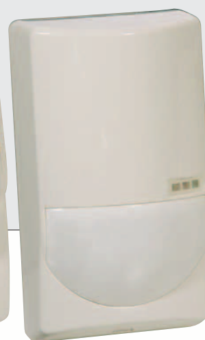
DX-40 / DX-60