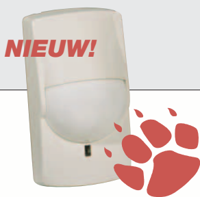
MX-40PT Pet Tolerant

Optex detectoren kenmerken zich door een hoge ongewenst alarm reductie dankzij de gepatenteerde "Quad Zone Logic" techniek.